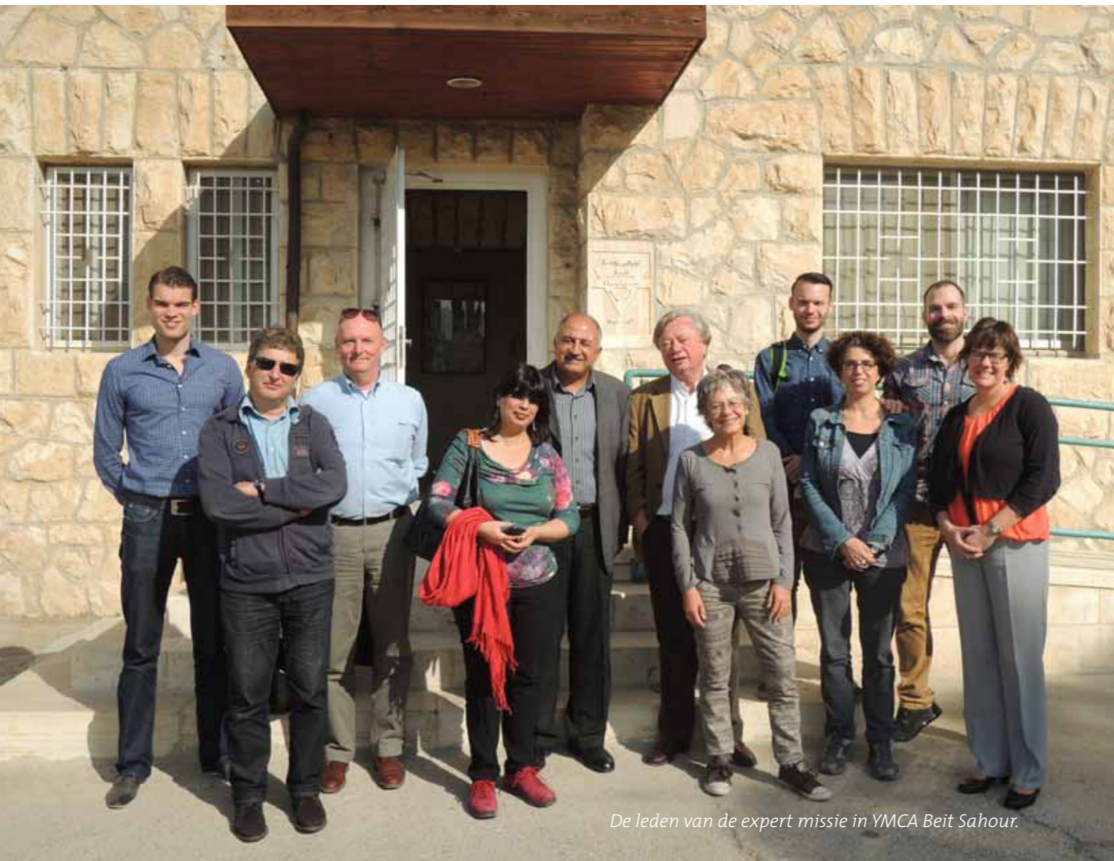
De leden van de expert missie in YMCA Beit Sahour.